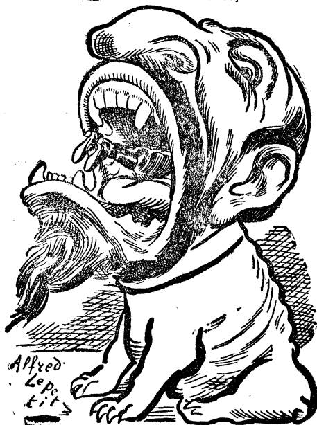
Les avaleurs de généraux

יאהר־תעניתים פאסטען בה"ב. שרעקט אייך נישט, געעהרטע דאקטוירים! הערט ווייטער: